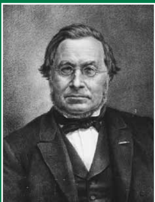
N. F. S. Grundtvig (1783-1872)

Var initiativtager til den folkelige, almindennede højskole, som byggede på det levende ord. Grundtvig støttede Christen Kold i arbejdet med at oprette Dalum Højskole