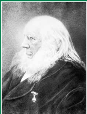
Christen Kold (1816-1870)

Købte i 1861 ca. 40 tønder land jord 4 kilometer syd for Odense og grundlagde året efter Dalum Højskole. Efter Kolds død i 1870 blev skolen fra 1886 videreført som Dalum Landbrugsskole.